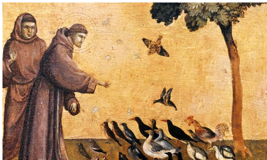
Saint François d'Assise (1182-1226) L'ami de toute la Création.

Il a choisi le nom de François en souvenir de St François d'Assise : « l'homme de la pauvreté, l'homme de la paix, l'homme qui aime et préserve la création. »